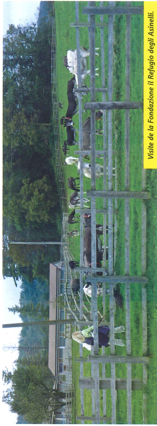
Visite de la Fondazione il Refugio degli Asinelli.

L'équipe Médi'âne se réjouit d'avoir pu œuvrer à la réalisation de ces journées sans frontière des pratiques en médiation asine et de pouvoir pérenniser cette dynamique toute naissante de Médi'asinus.